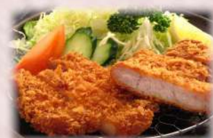
揚げ立て三元豚トンカツ