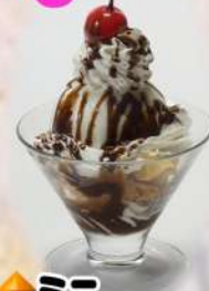
◆ ミニ チョコパフェ 460