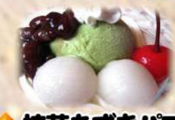
◆ 抹茶あずきパフェ 530