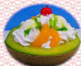
夏限定 まるごとメロンパフェ