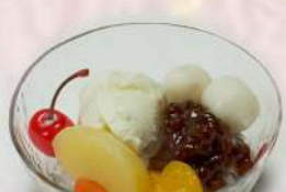
◆ 白玉クリーム あんみつ 530