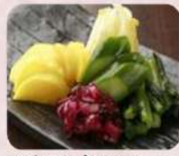
お新香盛り合わせ