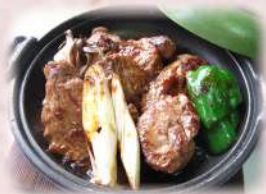
マグロのほほ肉ステーキ