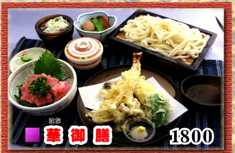
はな ■ 華御膳