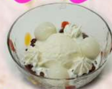
◆ 白玉クリーム ぜんざい 460