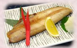
身が厚いホッケ焼き